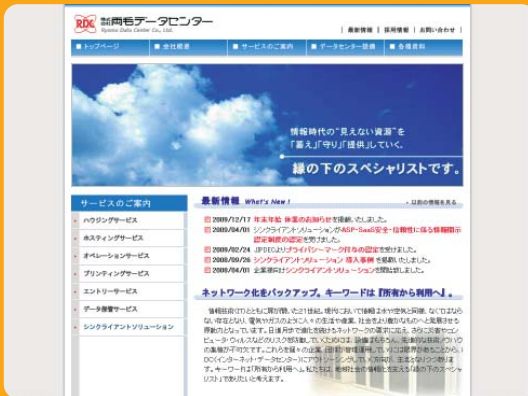
株式会社両毛データセンター ホームページ

— データセンターだからこそ可能な高品質の仮想デスクトップサービスをIsilon IQが実現