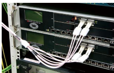
10Gbpsで接続されているFortiGate-3810A

今後、情報基盤センターではFortiOS 4.0へのアップグレードによるアプリケーション制御も検討。「さまざまなインターネットアプリケーションが登場しても、柔軟に対応できる体制を構築しておきたい」(松尾氏)と期待を語った。